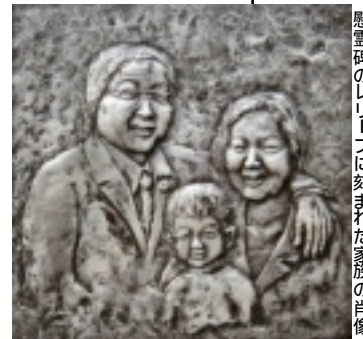
慰霊碑のレリーフに刻まれた家族の肖像